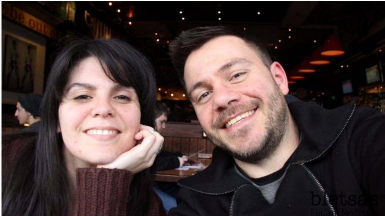
Να εδώ και η selfie μας με Electra Asrteri