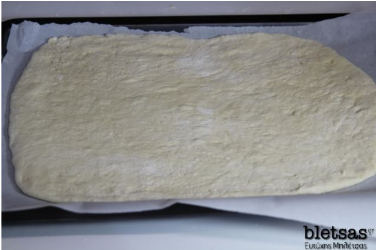
Βήμα 30 Κόβουμε λωρίδες το ζυμάρι